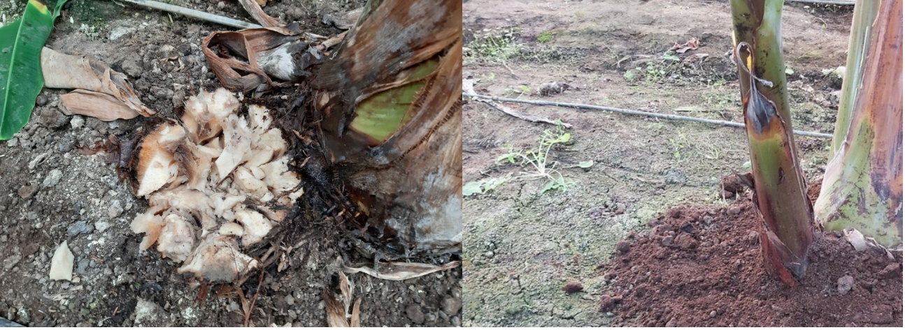
Resim. Rizomların (takozların) yerinde parçalanması ve keçi gübresi serilmesi

Son yıllarda keçi gübresi bakım sonrası uygulanmaya başlanmıştır. Bunun avantajının toprak yüzeyine serilen keçi gübresinin, toprağın ısınmasıyla toprak yüzeyine çıkan nematodları frenleyerek çoğalmalarını önlemesi olduğunu düşünüyoruz. Bakım dönemi toprak yüzeyine serilen keçi gübresi ve kimyevi gübreler toprakla derince karıştırılır. Bu karıştırma işlemi çapa makineleri ile yapılabileceği gibi bel küreği, muz kazması veya çatal bel ile yapılabilir.